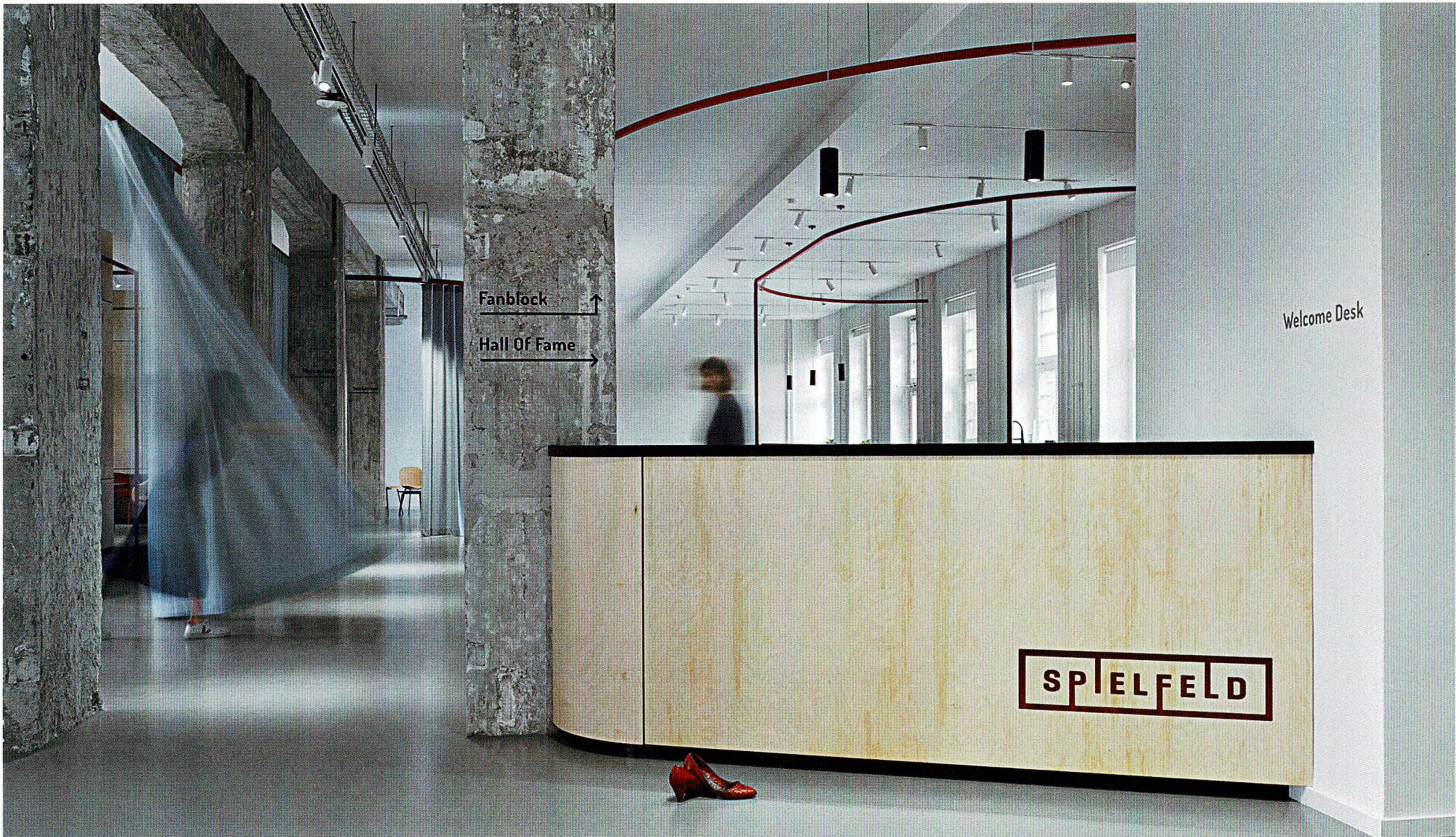
Kontrastreiche Materialität und Farbgebung: Fließende, taubenblaue Leinenvorhänge stehen harten Oberflächen gegenüber. • High-contrast materials and colours: flowing linen curtains against hard surfaces.