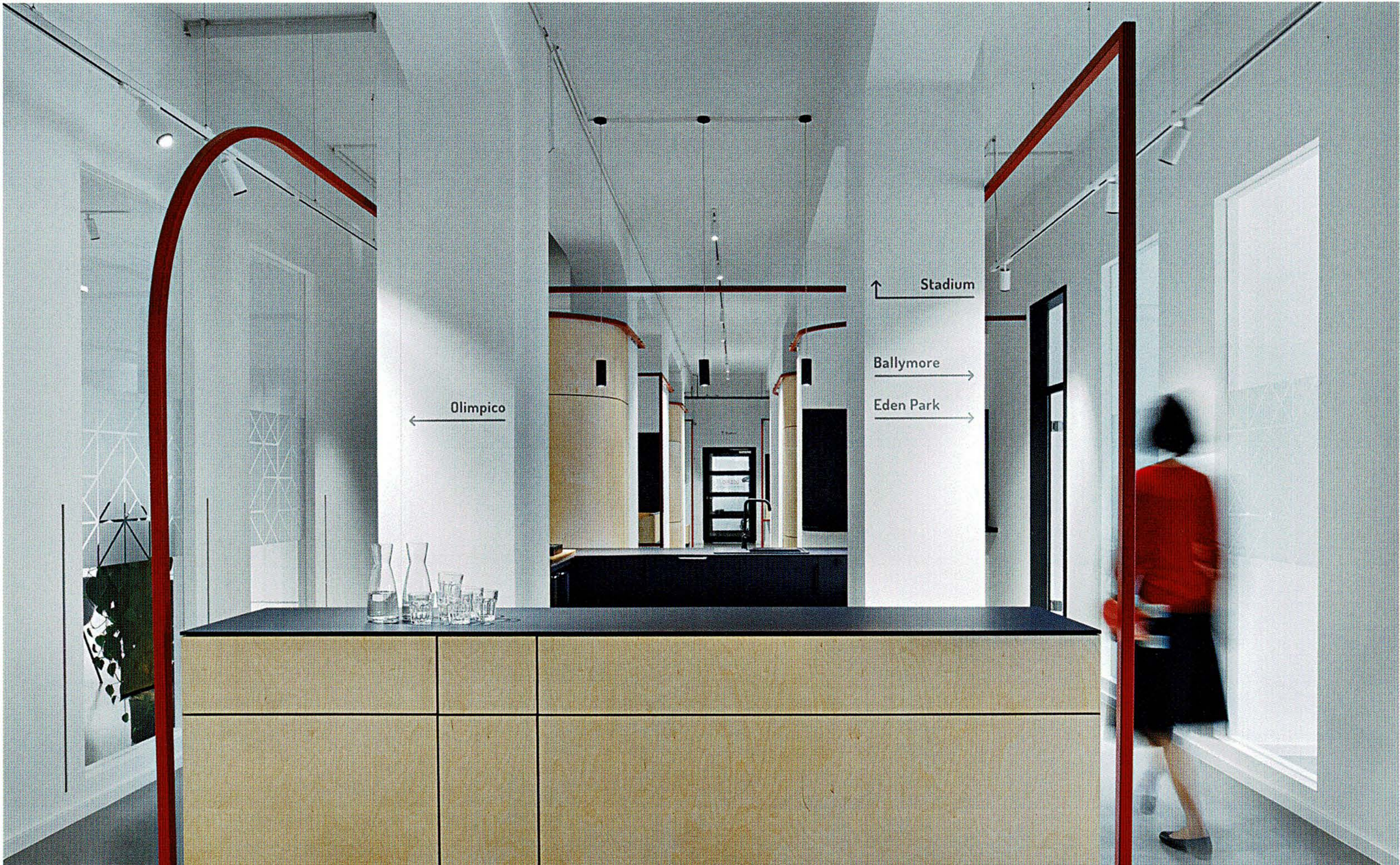
Zonen mit verschiedenen Aufenthaltsqualitäten laden den Nutzer ein, sich zu bewegen und zu begegnen. • Zones with different sojourn qualities invite users to move around and meet others.